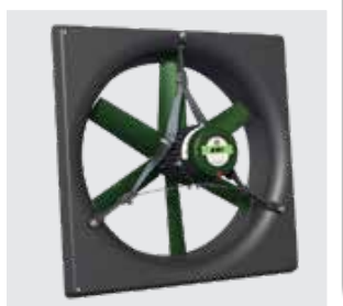
Ventilateur EMI sur cadre