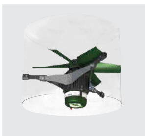
Ventilateur EMI intégrable en cheminée