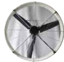
► Grille de protection (en option)