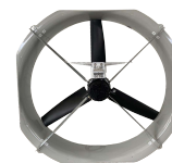
▶ Brasseur Mistral